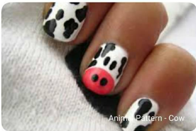
Animal Pattern - Cow