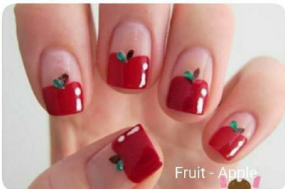
Fruit - Apple

Hasil kuku yang akan dipelajari dari Mirael Nail Arts Academy