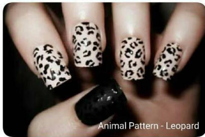
Animal Pattern - Leopard